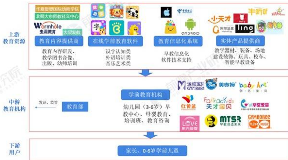
图表 50：早教产业全景图谱