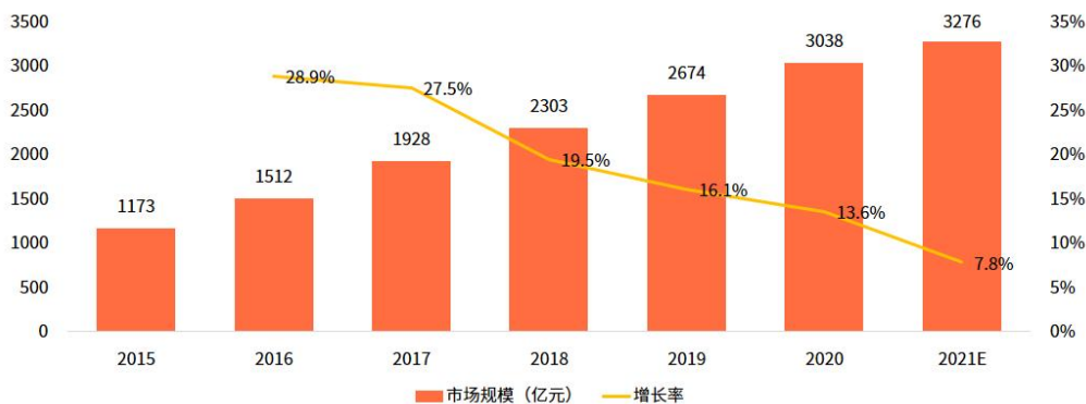
图表 49：2015-2021 年中国早教行业市场规模及增长率