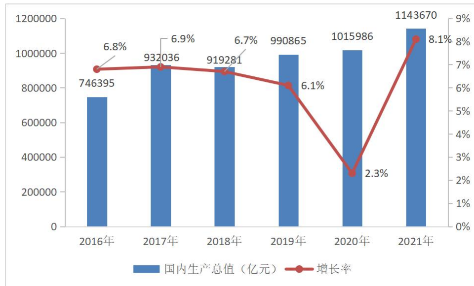
图表 3：2016-2021 年国内生产总值及增长率

尽管外部环境的严峻变化对国内经济造成了一定冲击，但我国的经济发展充满韧性，增长空间依然存在，国内经济长期向好的发展趋势不会因为外部力量的阻碍而改变，为本项目的实施奠定了良好的宏观经济环境。