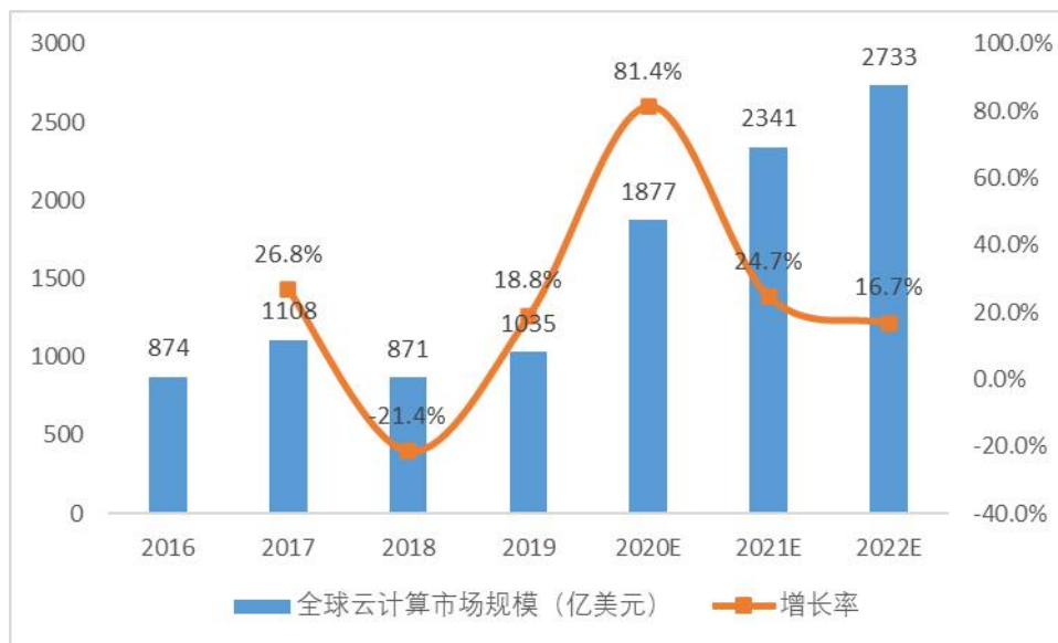
图表 9：全球云计算市场规模及增速

国际云计算市场保持高速增长。据最新统计，全球云计算市场较快增长，2019 年云计算市场规模达到 1653 亿美元，同比增长 21.3%；预计 2022 年市场规模达到 2733 亿美元。其中，SaaS 服务的增长是推动云计算市场增长的重要原因之一，2019 年全球 SaaS 服务市场规模将达到 1035 亿美元，同比增长 18.8%，预计 2022 年市场规模将达到 1578 亿美元。